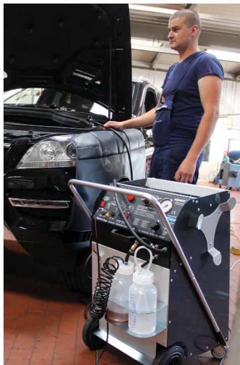
Ein Gerät der RoTWIN-Generation im Werkstatteinsatz: Es genügt höchsten Anforderungen, da es auch moderne Bremsanlagen vollständig entlüften kann.

So muss man es sehen. Beim Einsatz eines weniger leistungsfähigen Geräts, wie es Wettbewerber liefern, kann es bei modernen Fahrzeugen zu „weichen Bremsen“ kommen. Der Autofahrer bemerkt das sofort und reklamiert - einmal, zweimal, immer wieder. Oder, aus Haftungsgründen viel schlimmer noch für die Werkstatt, er baut einen Unfall, weil die Bremswirkung nicht ausreicht. Das hat sich dann richtig gelohnt! Wer für das Leben seiner Kunden verantwortlich ist, darf nicht an der falschen Stelle sparen.