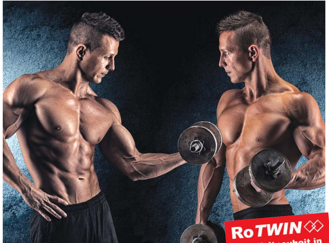
Für die Bremsenwartungsgeräte der neuen, Maßstäbe setzenden RoTWIN-Generation wirbt ROMESS mit diesen beiden starken Jungs. Warum?

RoTWIN Die Weltneuheit in der Bremsenwartung