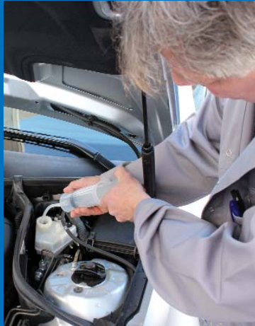
Ruckzuck ist der Ausgleichsbehälter entleert.