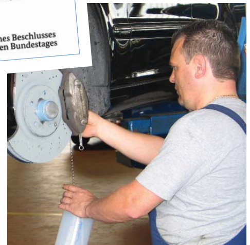
Nur mit einem Gerät der RoTWIN-Generation lassen sich moderne Bremsanlagen vollständig entlüften. Der Grund dafür liegt in der Kraft der zwei Pumpen (unten).