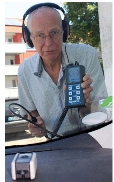
Der Ultraschallecksucher USM 20128 mit modulierendem Sender (vorne) im Wageninneren.