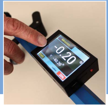
Die RNW 2009 mit elegantem Farbdisplay und Touchscreen.

Neue Elektronik steckt auch im Bremsflüssigkeitstester Aqua 10 und Aqua 12 Digital. Die Temperaturmessungen des Siedepunkts erfolgt jetzt noch genauer. Das Aqua ist in beiden Ausführungen unerreicht, da es als einziger Tester auf dem Markt eine geschlossene Messkammer besitzt und deshalb von Luftdruck- und Feuchtigkeitsschwankungen nicht beeinflusst wird im Vergleich zu den Geräten der Mitbewerber.