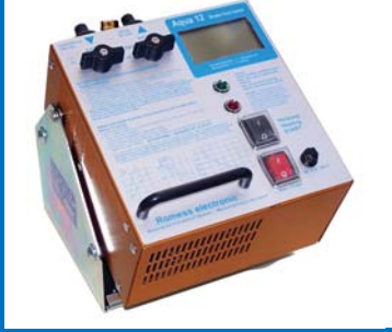
Aqua 12 Digi cihazı çok kesin çalışmaktadır.