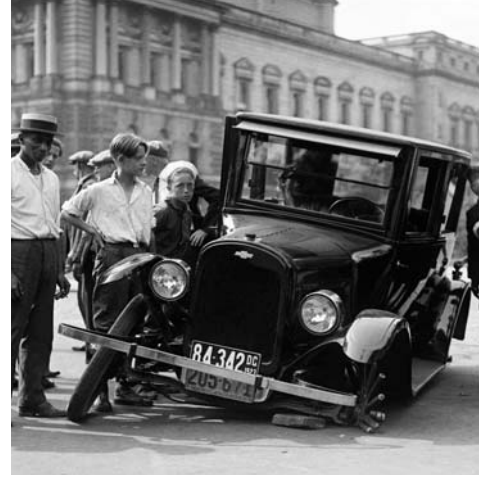
Eskiden frenlerin iyi çalışıp çalışmadığının önemi daha azdı.

1952 yılında ilk kez Jaguar diskli frene sahip bir arabayı satışa sundu. Fren güç