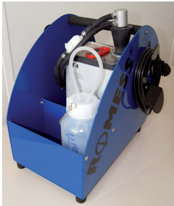
Weltweit sehr gefragt: das BW 1408 T von ROMESS, ein ebenso starkes wie preiswertes mobiles Gerät für den Bremsenservice.

Bei leerem Gebinde oder Tank wird das Hydrauliksystem abgeschaltet, und die Level-Anzeige leuchtet konstant. So wird