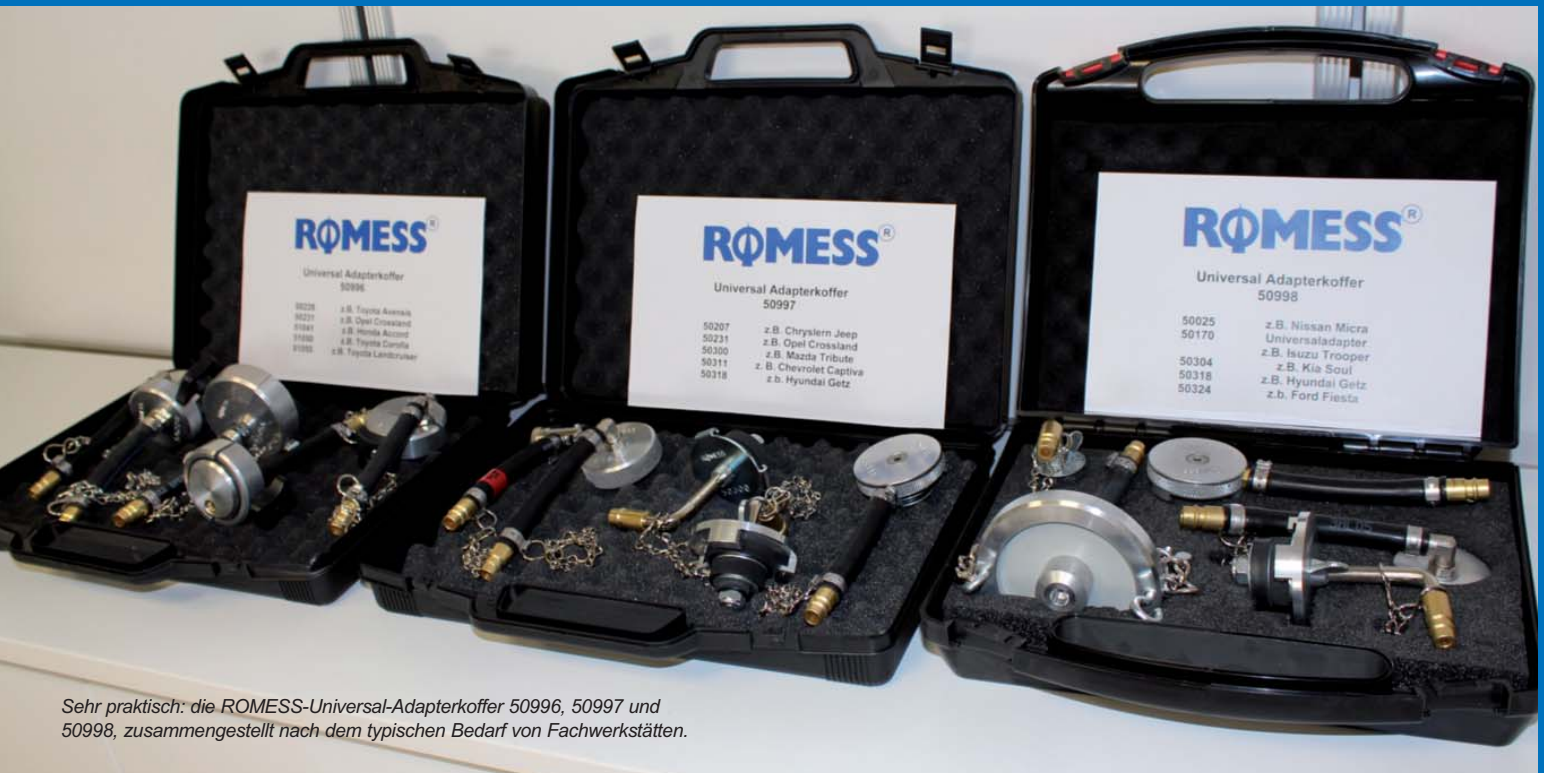
Sehr praktisch: die ROMESS-Universal-Adapterkoffer 50996, 50997 und 50998, zusammengestellt nach dem typischen Bedarf von Fachwerkstätten.

Das bietet sonst keiner: ROMESS hat aktuell rund 230 Adapter für die Kfz-Werkstatt im Angebot. Diese Vielfalt ist ein echtes Alleinstellungsmerkmal, das den Technologieführer im Segment Bremsenwartung zusätzlich vom Markt abhebt.