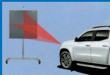
Beim Pickup der MB X-Klasse spart die Justage-Tafel Zeit und Nerven.

Sehr einfach zu handhaben ist die Radar-Justage-Tafel ROMESS 09842-10 für Fahrzeuge der Mercedes X-Klasse. Damit lässt sich der Radarsensor spielend kalibrieren.