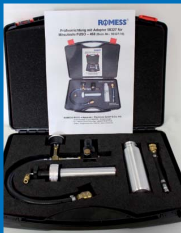
Mit dieser Vorrichtung lassen sich Adaptern komfortabel und zuverlässig prüfen.