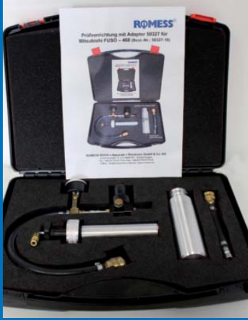
Bu düzenek ile, adaptörler kolay ve güvenilir bir şekilde test edilebiliyor.