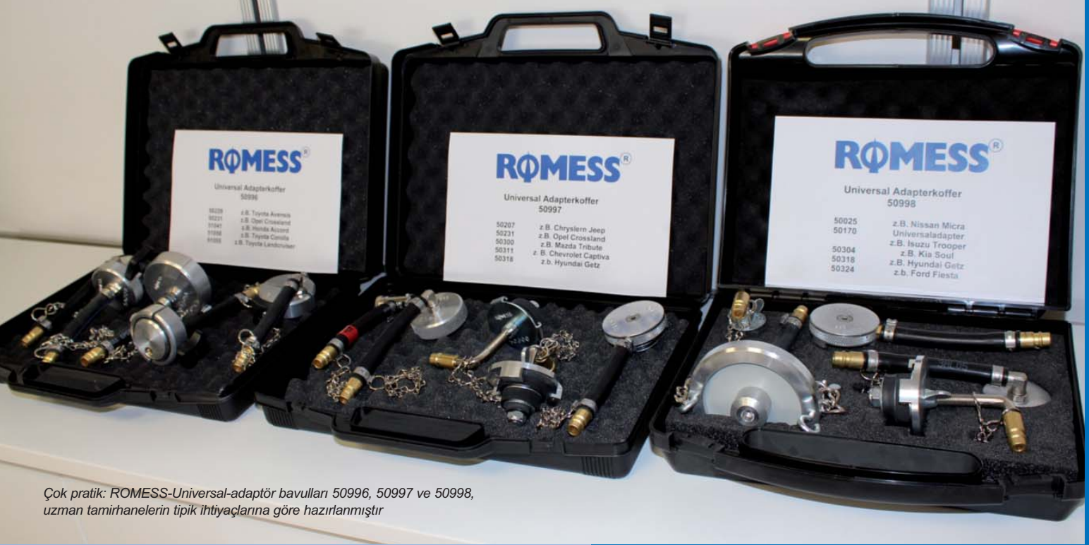
Çok pratik: ROMESS-Universal-adaptör bavulları 50996, 50997 ve 50998, uzman tamirhanelerin tipik ihtiyaçlarına göre hazırlanmıştır

Kimse bu şekilde sunmuyor: ROMESS, oto tamirhaneleri için şu an yaklaşık 230 adet adaptör sunmakta. Bu çeşitlilik bile, fren bakımı konusundaki teknoloji liderini piyasada eşsiz yapan bir belirtidir.