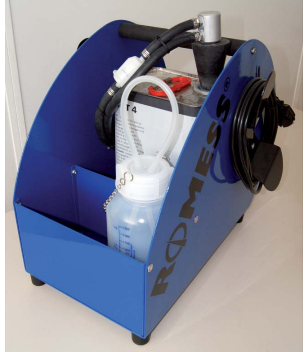
Dünyanın her yerinden talep görüyor: ROMESS'in BW 1408 T cihazı. Fren servisi için hem uygun fiyatlı, hem de güçlü.

Doluluk oranı ve çalışma basıncı sürekli kontrol altında. Depo veya bidonun boş olması veya bitmesi durumunda hidrolik sistem durmakta ve uyarı lambası sabit bir