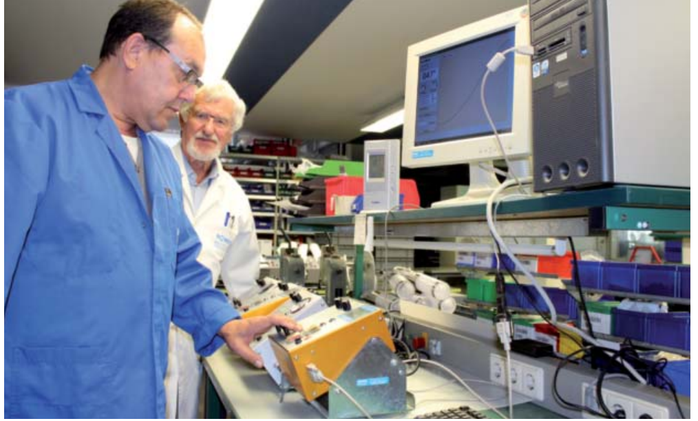
Güvenilir ve kesin bir şekilde çalışmaları için, Aqua model serisi fren sıvısı testerleri, üretim aşamasında hassasiyetle ayarlanmaktadır.

Almanlar elektronik arabaları özellikle ikinci araç olarak görmektedir. DAT in Piyasa gözlemcileri tarafından yapılan bir araştırmaya göre, yalnızca yüzde 39'u şu an elektrikliyi, gerçekte kullanılan bir aracın dışında yedek olarak hayal edebiliyor. Yüzde 45 için en fazla yedek araç olarak düşünülebiliyor. Yüzde 16'sı kararsız. Araştırmaya göre E-otoların ortalama menzili 415 kilometre ve bu çok sürelerin çoğu için az geliyor.