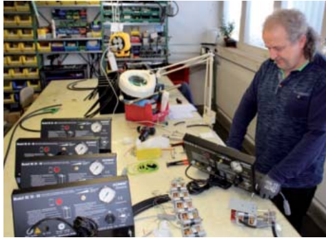
ROMESS-cihazları kalite damgası „Made in Germany“yi boşuna taşıyor. Cihazlar titizlikle üretiliyor ve yüksek kalitede işleniyor.

Pompaların giriş ve çıkışları simetrik olarak birleştiriliyor. Bu sayede yüksek akış basıncında ve yüksek akış miktarında sabit bir akış sağlanıyor. Bu işlem sırasında fren sıvısı hızlı ve etkili bir biçimde köpürmeden doldurulurken fren sistemi içerisinde bulunan gaz ve askı parçaları fren sisteminin dışına itilmekte.