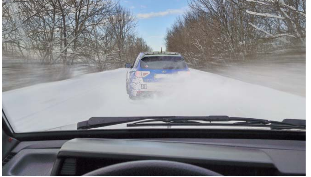
Kış kapımızın önüne yaklaştı. Soğuk mevsim, trafikte araç sürücülerine yine zorlu durumlar yaratabiliyor. Bakımı iyi yapılan frenler böyle zamanda önemini hatırlatmakta.